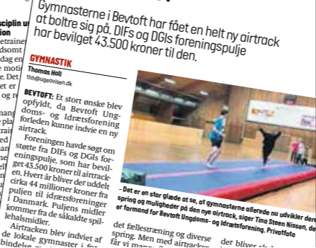
Gymnasterne i Bevtoft har fået en helt ny airtrack til boltræning på. DIFs og DGI's foreningspulje har bevilget 43.500 kroner til den.