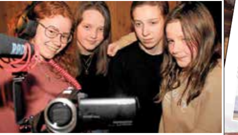
Et YouTube-værksted ser nu dagens lys i Ølstykke. Aktiviteten er kun blevet mulig pga. et tilskud fra DUF's lokalforeningspulje på 25.000 kr.