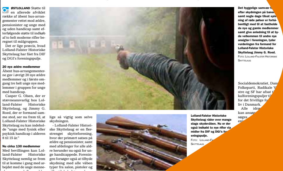
Lolland-Falster Historiske Skytteklub rider over mange slags skydevåben. Nu er der også indkøbt to nye rifler via midler fra DIF og DGI's foreningspulje.

Åbent hus-arrangementerne gav i øvrigt 20 nye ældre medlemmer og i første omgang tre helt unge nye medlemmer i gruppen for unge med handicap.