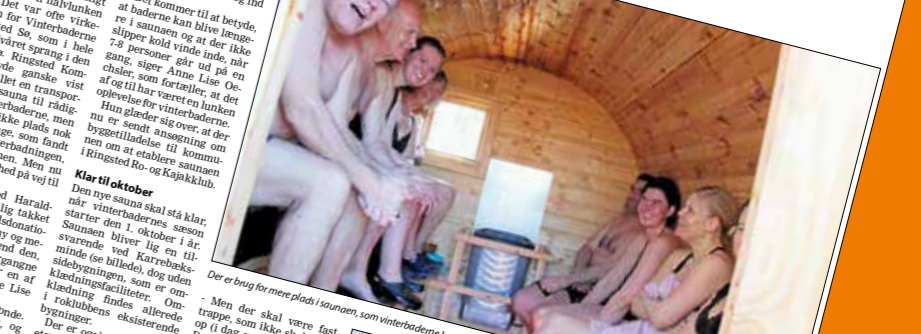
Der er brug for mere plads i saunaen, som vinterbadere bruger.

FRITID: Vinterbadere Haraldsted So har fået 310.000 kr. i støtte til en ny sauna med kold luft og klemte baller.