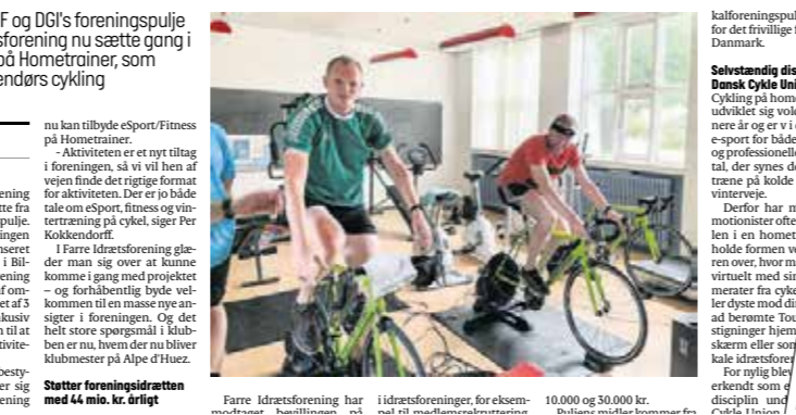
Farre Idrætsforening har modtaget bevilningen på 10.000 og 30.000 kr. De to midter kommer fra DIF og DGI's foreningspulje.

Med støtte fra DIF og DGI's foreningspulje kan Farre Idrætsforening nu sætte gang i eSport/Fitness på Hometrainer, som handler om indendørs cykling